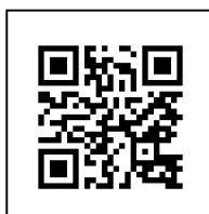
表1、表2のカリキュラムについて、詳細は、 右記のQRコードを使用し、カリキュラム内容、受講料など ご確認よろしくお願ひ致します。